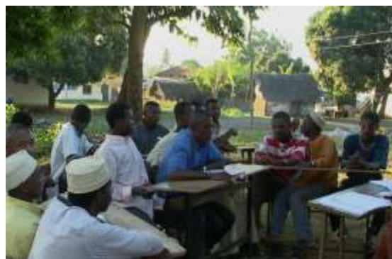
Séance focus jeunes