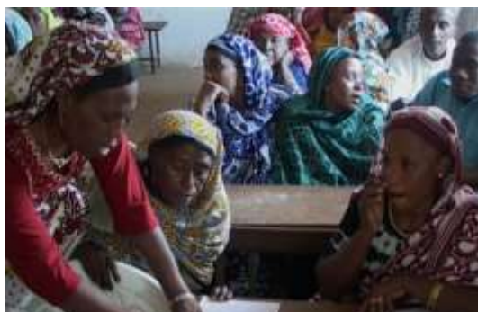
Séance focus femmes de Hoani

Des focus groupes (Hommes, Femmes, jeunes et groupes vulnérables) se sont constitués et les enquêtes sont animées par deux agents de l'équipe du FADC (un facilitateur et un rapporteur). Après la collecte des données, les membres de chaque focus groupe ont identifié des problèmes qu'ils jugent prioritaires pour le développement de leur village. Une séance de priorisation de ces groupes s'est tenue pour discuter et enfin hiérarchiser les problèmes. L'équipe du FADC a procédé à l'analyse des données et collecte des données secondaires pour enrichir les primaires. Une restitution du premier draft du projet de l'élaboration du PDL a eu lieu au niveau communautaire. Et enfin, une cérémonie de validation du Plan de Développement Local (PDL).